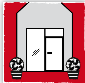
Eingänge & Türen